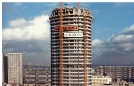
La tour Super-Italie à Paris