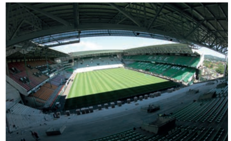
Stade Geoffroy-Guichard à Saint-Etienne