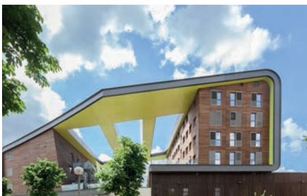
Cité Descartes à Champs sur Marne