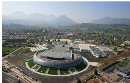
Le complexe « Le Phare » à Chambéry