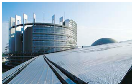
La tour du Parlement européen de Strasbourg