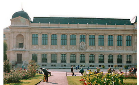
Muséum national d'histoire naturelle à Paris