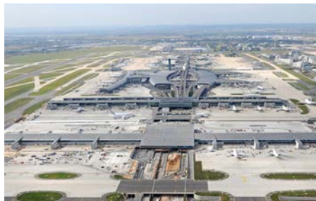
Le satellite 4 de l'aéroport de Paris-CDG