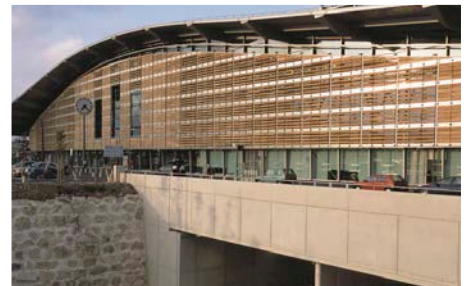
La gare TGV d'Aix-en-Provence