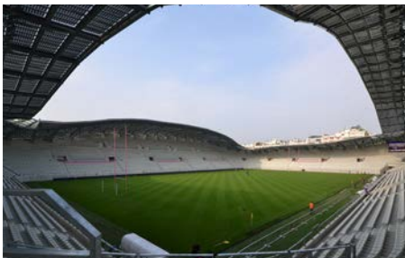
Le stade Jean-Bouin à Paris

Le savoir-faire et l'inventivité du groupe au quotidien lui permettent de relever de grands défis architecturaux et techniques. Retour en images sur des réalisations emblématiques menées par Léon Grosse depuis 135 ans sur tout le territoire français.